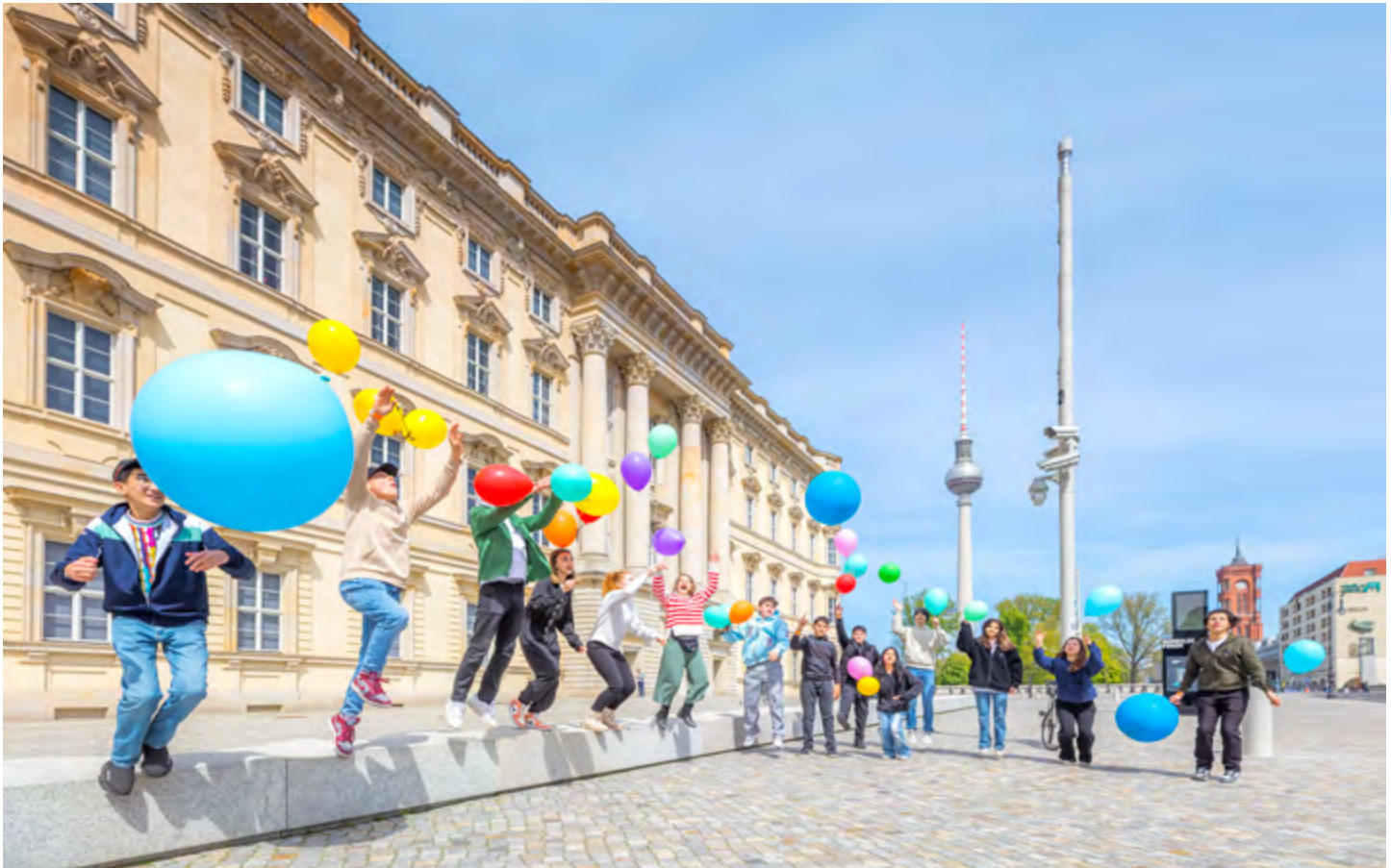
Schulklasse vor dem Humboldt Forum