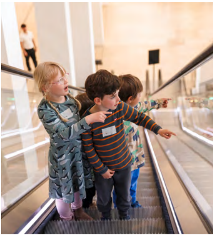
Erkunden des Humboldt Forums im Rahmen des Kitaprojekts Forum von Anfang an