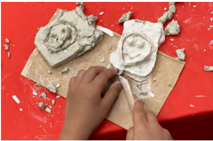
Modellieren mit Gips im Workshop Adler, Löwe, Krone