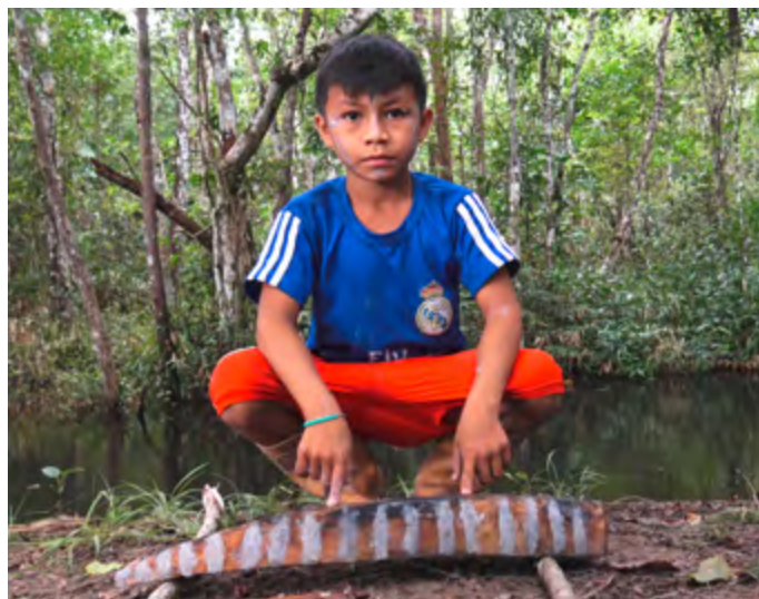
Filmstill aus dem Kinderfilm Wir machen einen Ye'kwana-Einbaum