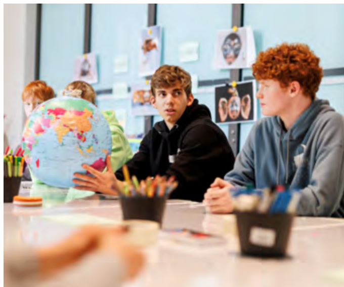
Schüler*innen diskutieren und arbeiten im Workshop Die Welt auf dem Kopf!

Wie könnte ein Austausch von Wissen, Informationen, Fähigkeiten und Objekten zwischen Gesellschaften und Gruppen aussehen, der nicht Machtverhältnisse wie Rassismus und Kolonialismus reproduziert? Was sind unsere eigenen Erwartungen an (Tausch-)Beziehungen und an den Umgang mit von uns Geschaffenen? Die Schüler*innen bauen Masken und diskutieren ihre persönlichen Vorstellungen, wie diese ausgestellt werden sollten. Anhand von Kulturgütern aus Süd- und Zentralamerika stellen sie die Arbeit von Museen infrage und diskutieren darüber, wie die Objekte nach Berlin gekommen sind.