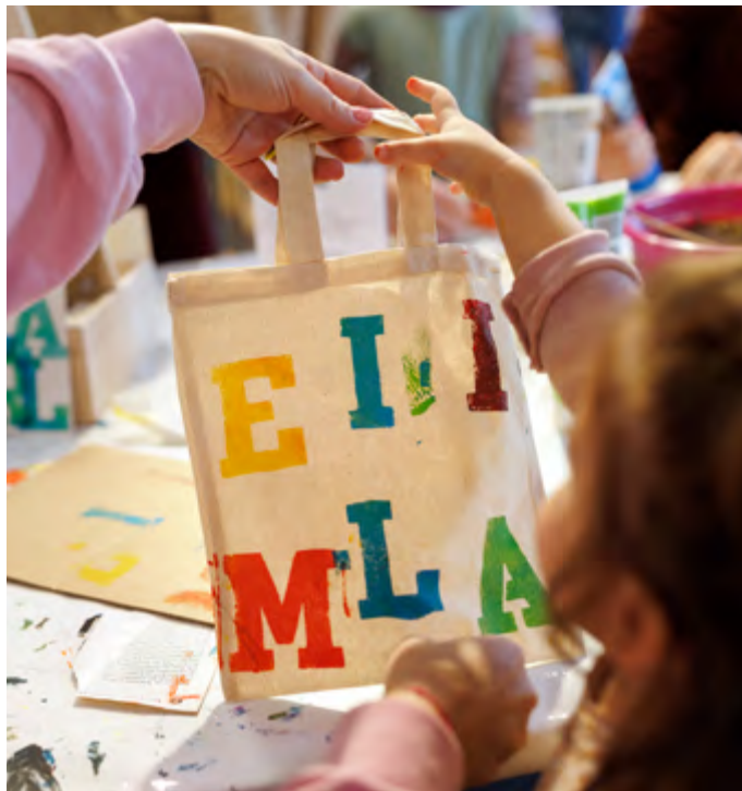
Gemeinsames Gestalten im WELTSTUDIO der Ausstellung BERLIN GLOBAL zum Thema Kinderrechte

Alle haben Rechte! Die Kinder begegnen auf spielerische Weise ihren UN-Kinderrechten. Wer hat sie beschlossen? Vor was schützen sie, was erlauben sie? Haben alle Kinder Kinderrechte? Die Schüler*innen lernen die Bedeutung der Kinderrechtskonvention kennen und hören vielleicht zum ersten Mal von globalen Institutionen wie UN und Unicef. Sie erfahren, wie es weltweit mit den Kinderrechten aussieht, und dass nicht alle Kinder denselben Alltag leben können. Ausgehend von ihren Ideen und Gedanken zu den zehn Kinderrechten gestalten sie kleine Webstücke, die sie miteinander besprechen, vergleichen und im Anschluss mit nach Hause nehmen können.