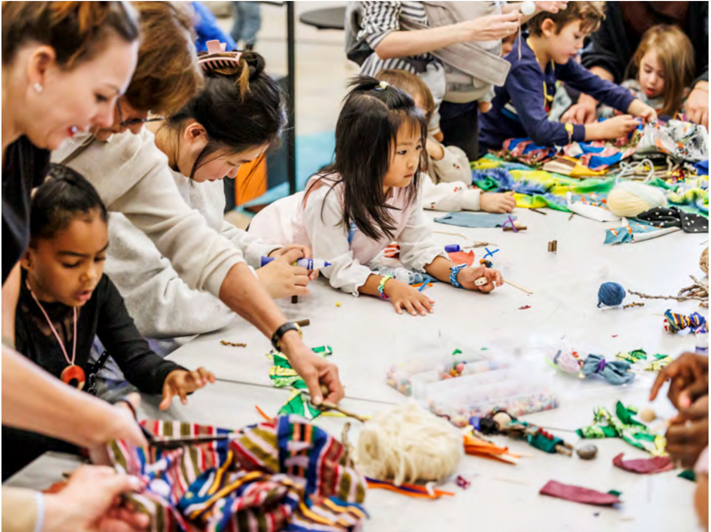
Kreatives Gestalten im Foyer des Humboldt Forums