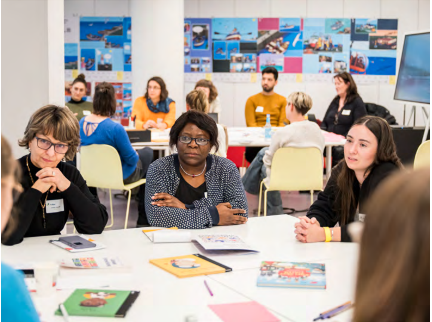
Fortbildungsveranstaltung in den Werkräumen