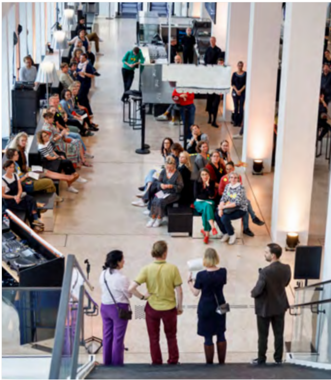
Austausch und Begegnung während der Teachers' Night im Humboldt Forum