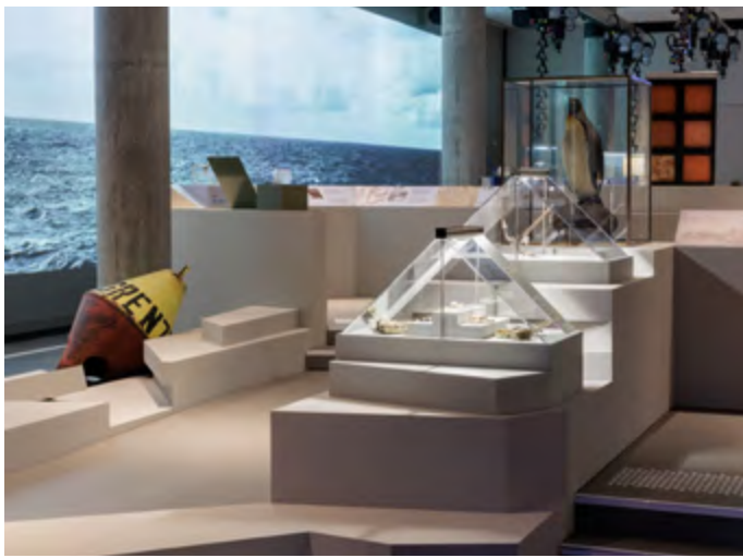
Ausstellung On Water. WasserWissen in Berlin im Humboldt Labor