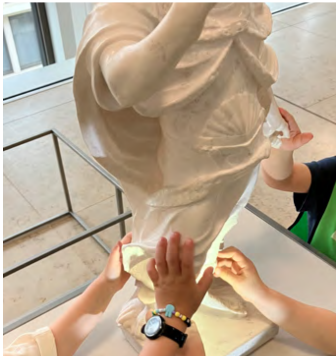
Erkunden eines Tastobjekts im Workshop Licht und Schatten

Weshalb wirken Statuen aus Marmor so lebendig? Und wie verändern sie sich im Spiel von Licht und Schatten? In diesem Workshop beschäftigen sich die Kinder mit unterschiedlichen Skulpturen, die sie während eines Rundgangs durch die Treppenhalle des Humboldt Forums entdecken. Spielerisch erschließen sie sich deren Darstellung und Ausdruck, untersuchen mit Hilfe von Hands-on-Materialien die Beschaffenheit der Materialien, erkunden mit Taschenlampen Details und erleben die Wirkung von Licht und Schatten. Im Anschluss gestaltet jedes Kind eine eigene Stabpuppe und erweckt sie und ihren Schatten mit der Taschenlampe zum Leben.