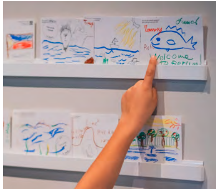
Zeichnungen im Humboldt Labor

Ist ein Fluss einfach nur Wasser? Oder ein lebendiger Organismus mit Bedürfnissen? Begleitend zur Ausstellung On Water. Wasser-Wissen in Berlin können Schüler*innen in diesem spielerischen Workshop die Spree mit ihrem eigenen Körper und ihrer Fantasie entdecken. Nach einer einführenden Kurzführung durch die Ausstellung erleben die Kinder durch Bewegung, Rollenarbeit und kleine Theaterszenen, wie sich Wasser anfühlt, was Tiere im und am Fluss brauchen und was passiert, wenn Menschen nicht gut auf Gewässer aufpassen. Durch die Übernahme nicht-menschlicher Perspektiven wird die Spree als Akteur wahrgenommen, den es zu schützen gilt.