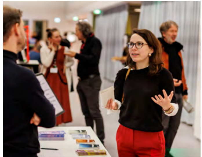
Information und Austausch in den Werkräumen

Das Humboldt Forum lädt zur dritten Teachers' Night Lehrer*innen, pädagogische Fachkräfte, Erzieher*innen sowie alle Interessierten ein, die Vielfalt kultureller Bildung zu entdecken. Kurzführungen, Performances und Drop-ins geben Einblick in die Bildungs- und Vermittlungsangebote für Kinder und Jugendliche und bieten Raum für Austausch und Vernetzung mit Kolleg*innen.