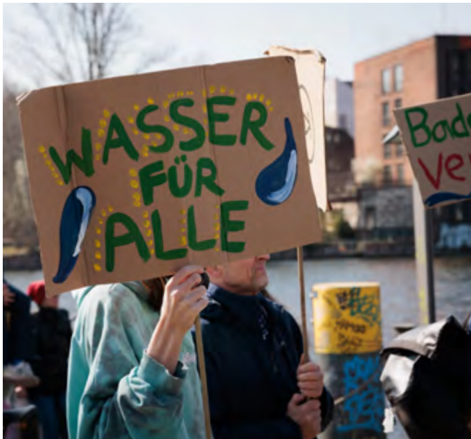
Veranstaltung am Weltwassertag 2025