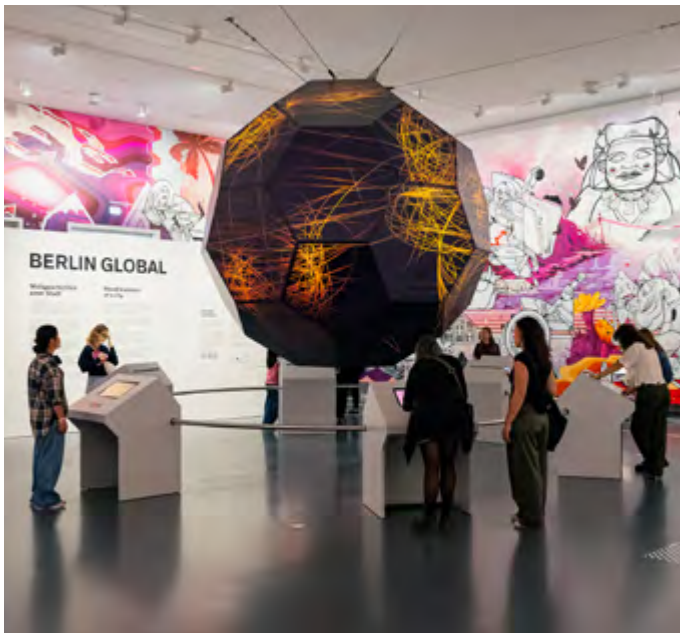
Im Raum Weltdenken der Ausstellung BERLIN GLOBAL

Das moderne Gebäude des Humboldt Forums sieht von außen aus wie ein barocker Schlossbau. Was steckt hinter der Bildsprache des rekonstruierten Fassadenschmucks? Und wie wirkt ein solches Gebäude in der Gegenwart? In einem dialogischen Rundgang durch Räume, Höfe und entlang der Fassaden setzen sich die Schüler*innen mit der Formensprache von Architektur auseinander und diskutieren über die Wirkung der rekonstruierten Elemente heute.