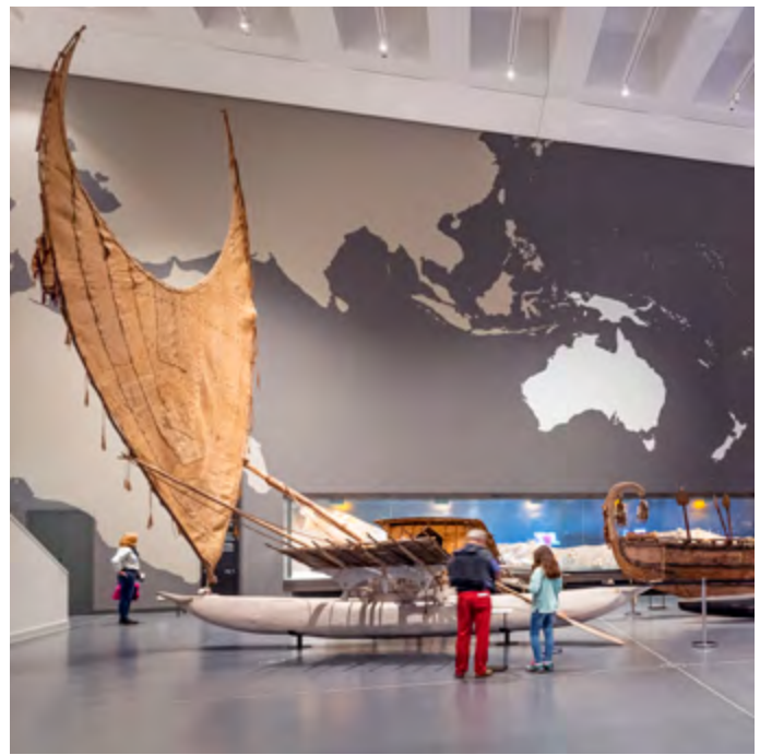
Boote-Kubus des Ethnologischen Museums

Der Hinduismus lebt von einer Vielzahl religiöser Traditionen, Gött*innen und deren Mythen. Anhand von Skulpturen des Museums für Asiatische Kunst lernen die Schüler*innen die Vielfalt der Gottheiten kennen: Shiva als Gott der Schöpfung und Zerstörung, die vollkommene Göttin Durga und den elefantenköpfigen Ganesha. Sie treffen auf den Stier Nandi und den lebenswürdigen Krishna, einen Avatar des Gottes Vishnu.