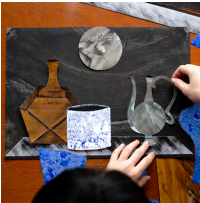
Kreativergebnis aus dem Workshop Ein Kabinett der Kuriositäten? Zeichnet und collagiert eure eigene Sammlung