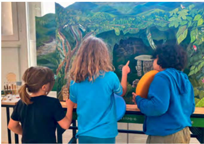
Schüler*innen im Workshop Schutzwesen