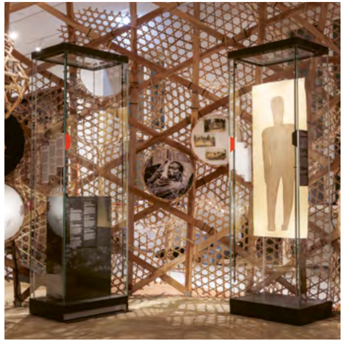
Blick in die Ausstellung Geschichte(n) Tansanias mit Werken von Amani Salim Abeid

Kann ein Fluss Rechte haben? Und wenn ja: Wer entscheidet darüber? Begleitend zur Ausstellung On Water. WasserWissen in Berlin können sich Schüler*innen am Beispiel der Spree mit den Herausforderungen für Flüsse in Zeiten des Klimawandels auseinandersetzen. Nach einer einführenden Kurzführung durch die Ausstellung schlüpfen die Teilnehmer*innen selbst in die Rolle gesellschaftlicher oder nicht-menschlicher Akteure und versuchen, unterschiedliche Positionen zum Wasser zu vertreten. Durch theatrale Mittel, Rollenarbeit und eine szenische Gerichtsverhandlung werden dabei gesellschaftliche Machtverhältnisse, Verantwortung und Interessenskonflikte erfahrbar und im Raum spielerisch sichtbar gemacht.