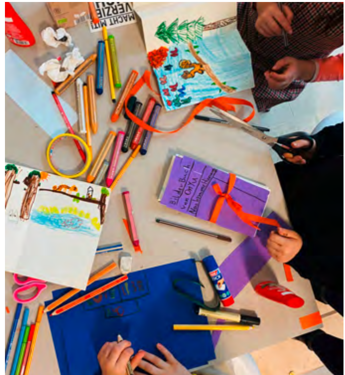
Erstellen von Rollbildern

Um den Stupa, ein traditionelles buddhistisches Bauwerk, befinden sich Reliefs, die Geschichten erzählen. Hinduistische und buddhistische Ausrollbilder, die Patuas und Thangkas, haben eine ähnliche Erzählstruktur. Davon inspiriert gestalten die Kinder eigene farbenfrohe Rollbilder und Leporellos mit ihren erfundenen Geschichten. Sie erfahren auch, dass es viele unterschiedliche Perspektiven auf die Objekte im Museum für Asiatische Kunst gibt und die dargestellten Figuren durchaus heldenhaft und spannend sind.