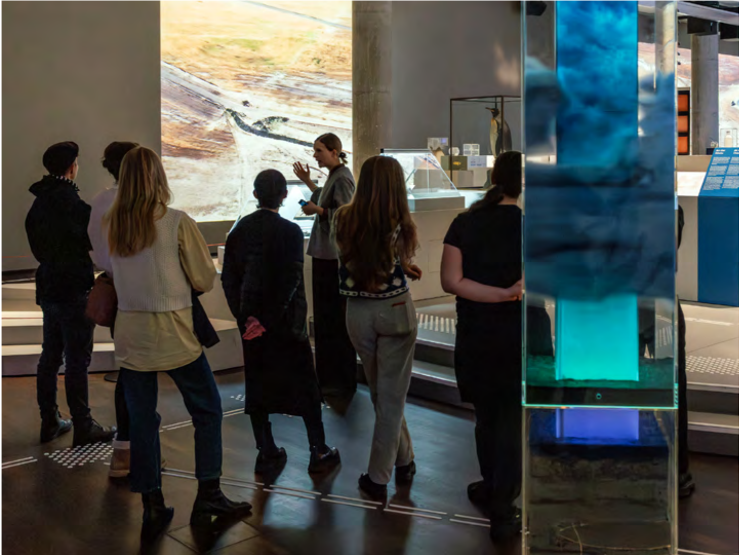
Führung in der Ausstellung On Water. WasserWissen in Berlin im Humboldt Labor