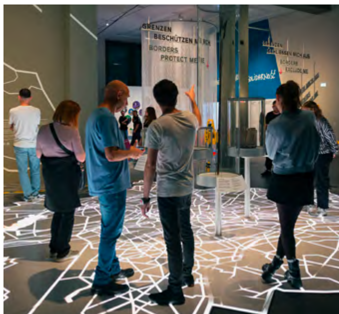
Im Raum Grenzen der Ausstellung BERLIN GLOBAL

Nach einem gemeinsamen Rundgang durch BERLIN GLOBAL stellen Vermittler*innen die handlungsorientierten Workshops sowie ein buchbares dreitägiges Projekt für Jugendliche vor. Anschließend erörtern sie, wie Schüler*innen sich dem Thema „Berlin und die Welt“ nähern – haptisch im WELTSTUDIO, beim Erstellen eines digitalen Kataloges oder eines Radio-Features. In der Fortbildung wird gezeigt, wie Moderator*innen die Jugendlichen dabei begleiten, globale Zusammenhänge kennenzulernen, eigene Haltungen zu entwickeln und diese darzustellen.