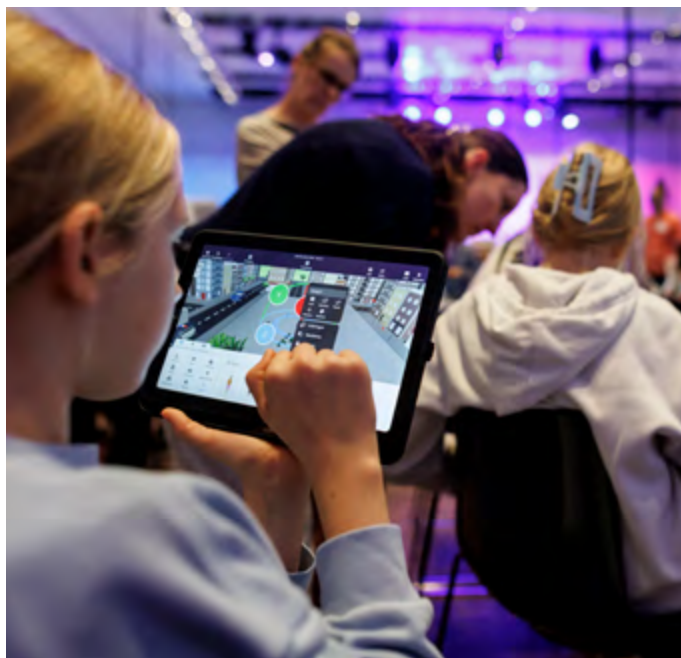
Entwerfen virtueller Welten

Was wissen wir über das Leben an diesem Ort vom Mittelalter bis in die Gegenwart? Für welche Zwecke wurden die Kellerräume einst genutzt und welche Arbeiten waren dort unten notwendig, damit das Leben oben – im Kloster, Schloss oder Museum – funktionierte? In diesem Workshop setzen sich die Schüler*innen mit dem Alltagsleben in verschiedenen Epochen auseinander, erforschen in Kleingruppen anhand von historischen Objekten und Räumen Themen wie Heizen, Kochen oder Lagern und ziehen Vergleiche zur eigenen Lebenswelt. Die Ergebnisse stellen sie anschließend ihren Mitschüler*innen vor.