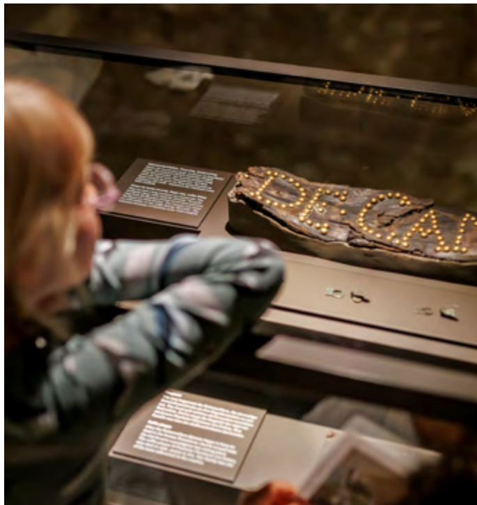
Erkunden des Schlosskellers

Was wäre, wenn niemand mehr arbeiten müsste? Aliens auf der Erde landen würden? Tiere nicht mehr eingesperrt werden dürften? Alle Satelliten ausfallen würden? In diesem Workshop stellen die Schüler*innen Gewohntes und Alltägliches infrage und denken über Konsequenzen nach. In Kleingruppen diskutieren sie je nach Altersstufe unterschiedliche Fragestellungen und gestalten ihre Ideen anschließend als virtuelle Welten, die sie mithilfe von VR-Technologie selbst betreten und erfahren können. Sie nutzen dafür die Software Delightex, die einen kreativen Baukasten mit Objekten, Lebewesen und geometrischen Formen bietet, welche beliebig verändert, ergänzt und animiert werden können.