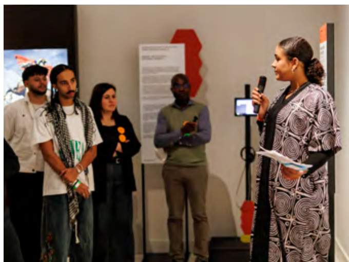
Performance Berlin Africa Reconference

Der Ort des Humboldt Forums war im Laufe der Geschichte immer wieder Schauplatz herrschaftlicher Selbstdarstellung wie auch revolutionären Aufbegehrens der Bevölkerung. Welche Spuren der Geschichte lassen sich heute noch finden? Anhand von Originalobjekten und historischem Bildmaterial diskutieren die Schüler*innen in einem dialogisch geführten Rundgang unterschiedliche Wege zu politischem Wandel.